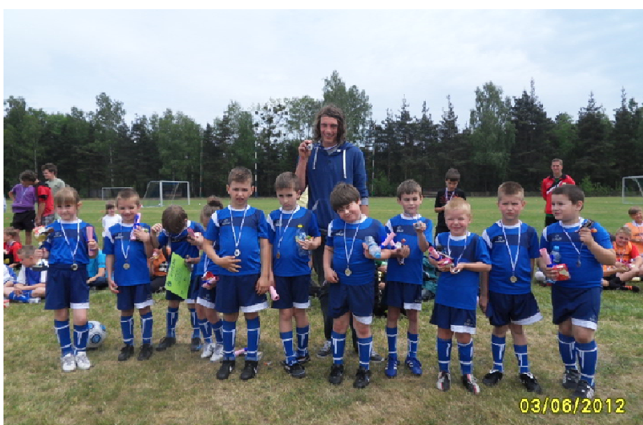
Nasza najbardziej rozwojowa drużyna- „Żaki”

Drużyny trampkarzy starszych i młodszych trenują dwa razy w tygodniu (w miarę możliwości i dostępności sal gimnastycznych). W lutym drużyna trampkarzy starszych uczestniczyła w turnieju zorganizowanym w Lublińcu, do którego zgłosiło się 12 drużyn (4 grupy po 3 drużyny). Drużyna nie odniosła sukcesu, ale dzięki temu turniejowi, który odbył się na wstępie przygotowań zimowych, młodzi piłkarze mieli możliwość sprawdzenia swoich umiejętności i dostrzeżenia braków szkoleniowych.