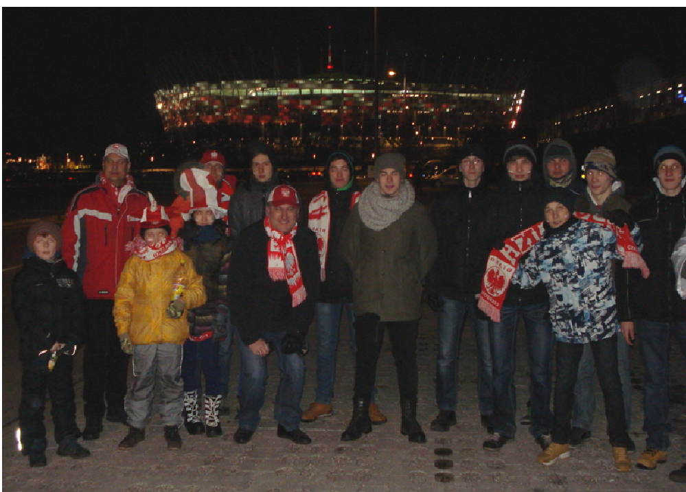
Przed wejściem na Stadion Narodowy