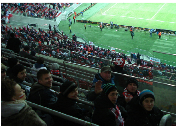
Przed meczem Polska– San Marino